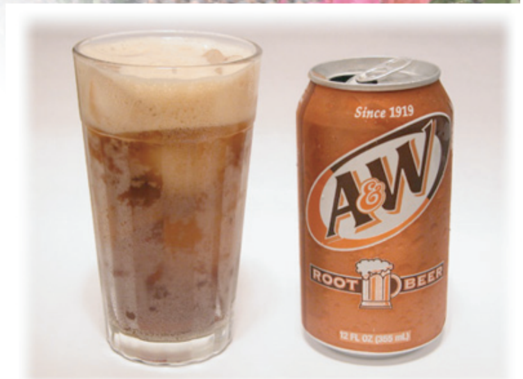
▲ルートビア 沖縄のハンバーガーショップA&Wのオリジナルドリンク。甘みがありバニラの香りがします。ビミョーな味ですが、病み付きになる人は後を絶たず、那覇空港到着と同時に空港のA&Wに駆け込みます。一杯！の人が多いためか… ※ビールではありません