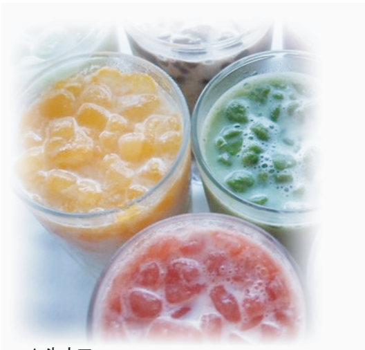
▲氷カフェ ミルクと溶け合う味覚のハーモニー。