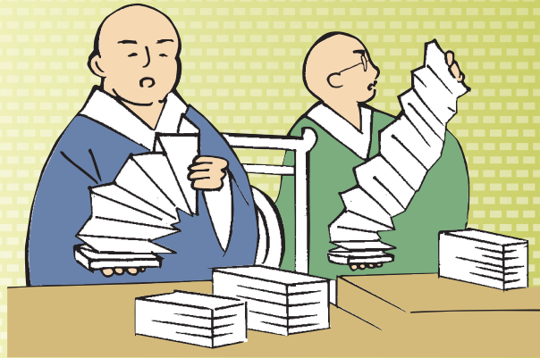
比叡山延暦寺より大徳出仕・導師による大般若経本加持